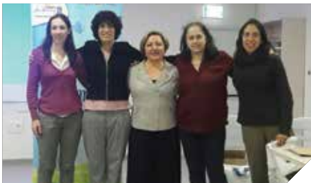
מעודדים לבריאות ואיכות חיים