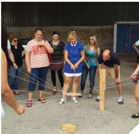
ימי עיון ומודעות

נעמת ויחידת הבריאות, סדנא להורים על גבולות בגיל ההתבגרות דרך מנחה ממכון אדלר בשיתוף יחידת הנוער ויחידת הבריאות, פעילות הסברה לצמצום שימוש באלכוהול בשיתוף מדריכי מוגנות, יחידת הנוער והרשות הלאומית לבטיחות בדרכים.