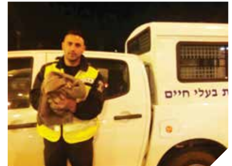
מצילים בעלי חיים

התושבים נקראים להמשיך ולהגיע פעם בשנה על מנת לחסן את כלביהם כנגד מחלת הכלבת הקטלנית.