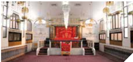
בית הכנסת הקראי