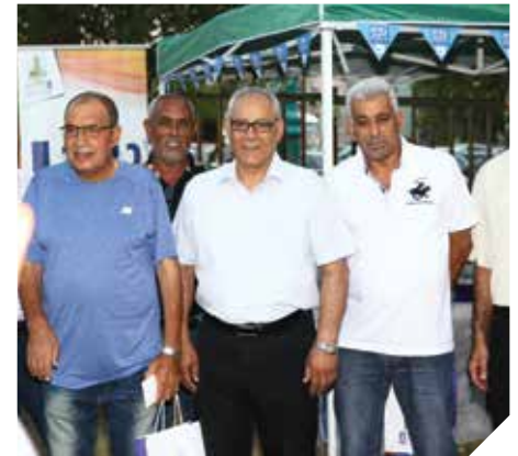
מתנדבים בקהילה הערבית