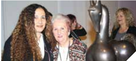
מצדעיים לאמני רמלה