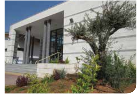
בית כנסת חדש