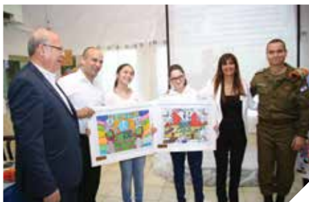
משקיעים למענכם בביטחון