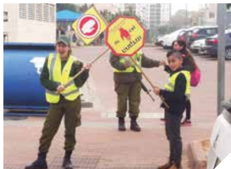
חציה בטוחה עם משמרות זהה"ב

גם במהלך 2016 המשיכה העירייה בפעילות משמרות הזהב בסמיכות לכלל מוסדות החינוך ברחבי העיר. השנה תוגברו מעברי החצייה ב-21 עובדים נוספים, בסמוך לבתי הספר היסודיים ברחבי העיר.