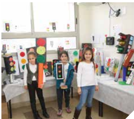
לומדים זהירות בדרכים