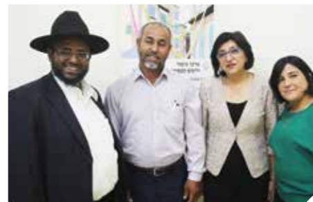
מגשרים ויוצרים דיאלוג בקהילה

ניתן לפנות באמצעות טל. 08-9771899, באמצעות המייל: m_gishur@ramla.muni.il , il, או באתר: www.ramla.muni.il/gishur/index.html