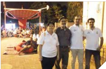
סיירת הורים למען בני נוער

נעמת ויחידת הבריאות, סדנא להורים על גבולות בגיל ההתבגרות דרך מנחה ממכון אדלר בשיתוף יחידת הנוער ויחידת הבריאות, פעילות הסברה לצמצום שימוש באלכוהול בשיתוף מדריכי מוגנות, יחידת הנוער והרשות הלאומית לבטיחות בדרכים.