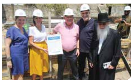
אבן הפינה לחממה הטכנולוגית