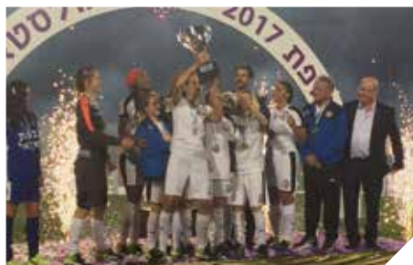
רמלה מארחת את הגולסטאריות

האצטדיון העירוני שעבר מתיחת פנים לפני כשנתיים הפך למגרש מבוקש המארח קבוצות ליגת העל ונבחרות ספרד, אנגליה, גרמניה וצרפת שלקחו חלק באליפות אירופה לנבחרות נשים עד גיל 19 בכדורגל. כן אירחה העירייה באצטדיון העירוני את משחק הגמר של תוכנית הריאליטי "גולדסטאר" במסגרתו שיחקו קבוצת הסלאב "הגולסטאריות" כנגד שחקניות נבחרת כנסת ישראל בראשותה של שרת הספורט והתרבות ח"כ מירי רגב.