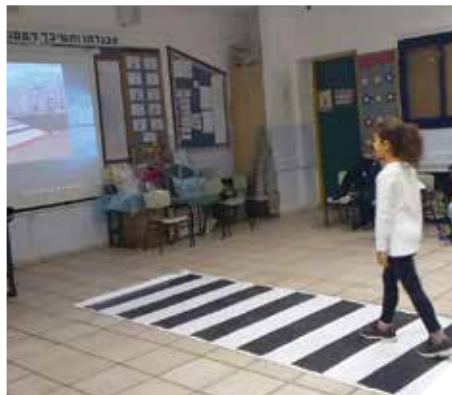
לומדים חציה בטוחה

יום המחויבות הארצי לבטיחות בדרכים התקיים השנה בחודש נובמבר ברחבי העיר, בין היתר בשוק העירוני, בקניון קריית הממשלה ובמוסדות החינוך, בנושא העלאת המודעות וחיזוק הצורך ללקיחת אחריות אישית במאבק בתאונות הדרכים, תוך מתן דגש על התנהגות הולכי הרגל וגילוי ערנות לחצייה בטוחה.