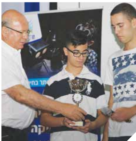
גביע ראש העיר למדעים ורובוטיקה

מערכת החינוך ברמלה משקפת ומעודדת את הדו-קיום בעיר רבת תרבותית: מנהלי בתי הספר בעיר, יהודים וערבים, משתתפים בהשתלמות "חיים משותפים"; הפעלת תוכנית "בואו נדבר" ללימוד ערבית בבתי הספר היהודיים; שילוב תוכנית "מפתח הלב" ו"חיים משותפים" יחד, בהובלת הרכזות החברתיות; צמדי בתי ספר יהודים וערבים, חילוניים ודתיים, יוצרים שיתופי פעולה ייחודיים.