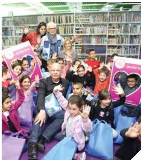
יום המעשים הטובים