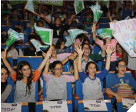
מקדמים את איכות הסביבה

העירייה מסייעת בטיפול במקורות רעש המטרדיים תושבים, לרבות דרישה להקמת מתרסים אקוסטיים ומפקחים על אתרי שידור סלולאריים, לרבות פיקוח על הקמה ותפעול של אתרי שידור סלולאריים. את תוצאות המדידה ניתן לראות באתר האינטרנט העירוני.