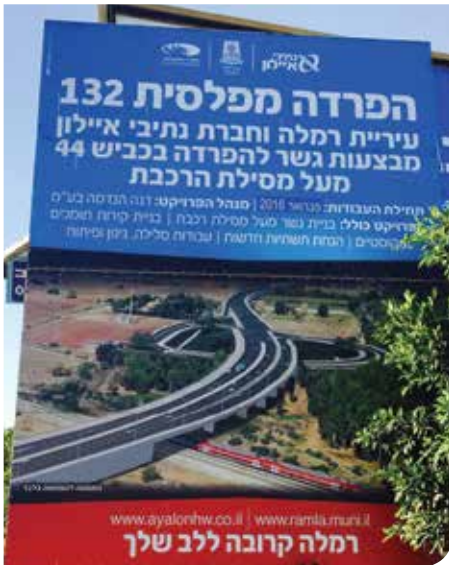
הפרדה מפלסית בכניסה הראשית לעיר