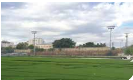
מגרש דשא סינטטי מודרני בג'אורני