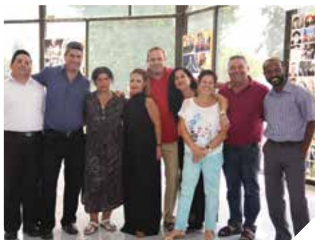
צוות מוביל ויצרתי

רחוב עוזי חיטמן 31, קריית האומנים, 08-9209830