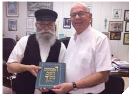
מוקירים את התינה

ביטחון תזונתי. תוכנית סיוע למשפחות במצוקה מתמשכת או במשבר המוכרות ברוחה, לקבלת חבילת מזון מדי חודש. הסיוע ניתן על פי קריטריונים, לאחר הפניה דרך עובדת סוציאלית. התוכנית בשיתוף עמותת אשל ירושלים ומשרד הרווחה. אפיקים. תוכנית להכנה לשוק העבודה לצעירים הנזקקים להכנה, העצמה, השלמת השכלה וליווי אישי לצורך קליטה בשוק העבודה. כ-20 צעירים השתתפו השנה בתוכנית, המופעלת בשיתוף מרכז קשתות.