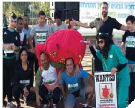
מעלים המודעות למניעת מחלת הסרטן

< דו"ח תשומת לב – פרויקט ייחודי של הסברה ואכיפה לשיפור איכות החיים ברמלה, שוטרי תחנת רמלה, אנשי יחידת הפיקוח, השיטור העירוני ומתנדבים, חילקו דו"ח תשומת לב לתושבים ולבעלי עסקים שמטרתו להסב את תשומת לבם לעבירות שנגעו בנושא איכות חיים, ניקיון, רעש ועוד