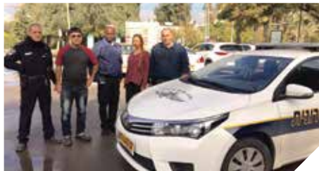
שומרים על הסדר

עיריית רמלה פועלת ללא הרף להעלאת תחושת המוגנות ולשמירה ועל הסדר הציבורי בעיר באמצעות יחידת הפיקוח העירוני ויחידת השיטור העירוני בעיר פועלות שתי ניידות 24 שעות ביממה. יחד עם המוקד העירוני 108 מטפלת העירייה במפגעים ואוכפת ביעילות הפרות סדר העלולות לפגוע באיכות חיי התושבים.