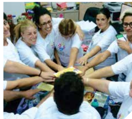
מטפרים להורי צמי"ד

שירותים מיוחדים כגון השמות במסגרות של דיור מוגן, בתעסוקה מוגנת ונתמכת, במרכזי יום סיעודיים טיפוליים, במעונות יום שיקומיים, במועדונים חברתיים, במסגרות יום ארוך לילדים הזכאים לכך באשכול גנים לימן ובבית ספר יובלים ובי"ס סיני ועוד. כמו כן מתן שרותי סייעות, שילוב במעונות, הדרכה שיקומית לעיוור, ייעוץ והדרכה פרטנית וקבוצתית, הפניות למכוני ייעוץ וגורמי סיוע בקהילה, פיתוח שירותים לנכים במשותף עם קרן שלם והמוסד לביטוח לאומי וימי הסברה. רכזת מש"ה (מגובלות שכלית התפתחותית) 08-9771623, רכזת שיקום ואוטיזם- 08-9771808.