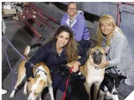
בית חדש בארצות הברית

השירות הווטרינרי העירוני מפקח ומבקר את איכות המזון והמצב התברואה בעסקים באמצעות עריכת בדיקות טרום שיווק למזון הנכנס לעיר ועריכת מאות ביקורות תברואיות בעסקי המזון כל זאת במטרת למנוע שיווק של מוצרי מזון מן החי, שאינם ראויים למאכל אדם. בשירות הווטרינרי ניתן ייעוץ לבעלי עסקי מזון, לשם קידום המקצועי ותיקון ליקויים שנמצאו בביקורות התברואיות.