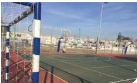
מגרשי ספורט משולבים

לתשלומים ובירורים וקו החינם לתקלות שוטפות: 1-800-800-151 לדיווח על תקלה ודליפה של מים וביוב בבית הפרטי, בגינה הציבורית והפרטית ובמקום העבודה, או דיווחים על גניבות ושימוש לא חוקי אחר במים, ניתן וצריך להתקשר ולדווח לקו החינם: 1-800-800-559