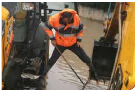
מטפלים סביב השעון

לתשלומים ובירורים וקו החינם לתקלות שוטפות: 1-800-800-151 לדיווח על תקלה ודליפה של מים וביוב בבית הפרטי, בגינה הציבורית והפרטית ובמקום העבודה, או דיווחים על גניבות ושימוש לא חוקי אחר במים, ניתן וצריך להתקשר ולדווח לקו החינם: 1-800-800-559