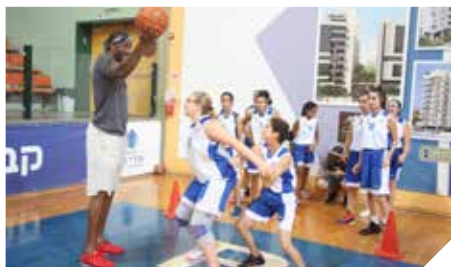
אימון אישי עם כוכב ה-MBA אנארה סטודמאייר