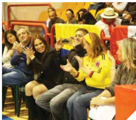
עשור לעלייה מאמריקה הלטינית

מוקד קליטה נתן שירות לקהילה האתיופית במציאת תעסוקה סיוע בהכשרה מקצועית, פעולות חברה ותרבות, סדנאות ועוד. השנה נפתחו במימון שיקום שכונות הכשרות תעסוקתיות בתחומים שונים, ביניהם איפור מקצועי, מלגנות, קורס נהגי משאיות, קורס מחשבים, יזמות עסקית הכנה לשוק העובדה ועוד. בנוסף חולקו מלגות להכשרה מקצועית.