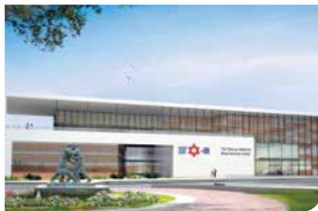
בנק הדם של ישראל ברמלה