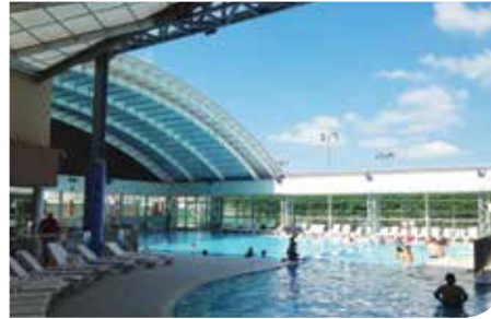
בריכה מקורה ומחוממת