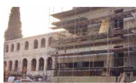
קמפוס טכנולוגי מדעי