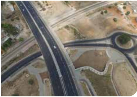
הפרדה מפלסית 208