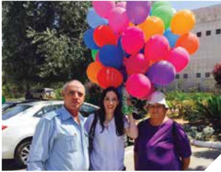
פועלים למיגור העישון