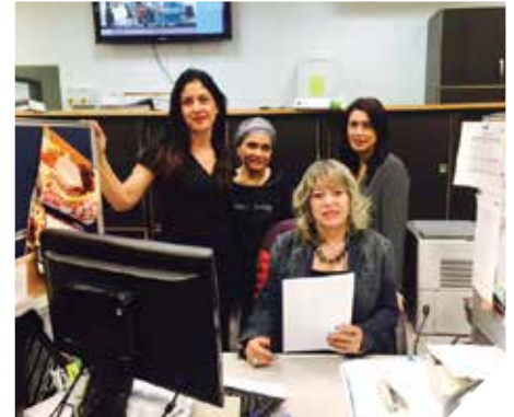
סל שירותים מגוון ומקצועי

למשתמש, ושודרגה רמת שקיפות פעולות העירייה באתר. כמו כן אחראית המחלקה על ניהול מרכז התקשורת העירוני בו אולפנים מודרניים ללימוד רזי עולם הטלוויזיה והרדיו.