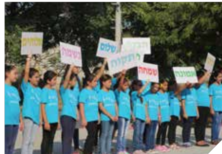
לומדים באמונה ובשמחה

במסגרת תכנית קרב נחשפים תלמידי העיר לתכניות העשרה ייחודיות, לדרכי הוראה מרתקות ולעולמות למידה ויצירה חדשים באופן המעורר סקרנות ויוצר התחדשות ואתגר בפריסה רחבה של תחומים, כדוגמת אמנות פלסטית, טבע וסביבה, תיאטרון ודרמה, מחול ותנועה, מוסיקה, פיתוח חשיבה, מדע וטכנולוגיה, מחשבים, אוריינות, חברה ותרבות, צילום ותקשורת, ספורט, כישורי חיים, אלטרנטיבי, עם וארץ ישראל ועוד.