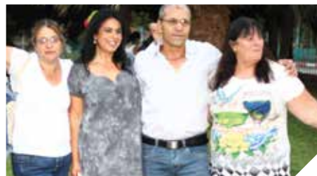
מחבקים את משפחת אקים

בגיר סובל ממוגבלות שכלית התפתחותית, במימון משרד הרווחה. התוכנית מספקת מענה טיפולי והדרכה בנושא כישורי חיים. הפנייה דרך העו"ס המטפל. כניסה לתוכנית ע"פ קריטריונים ותלוי תקציב של משרד הרווחה.