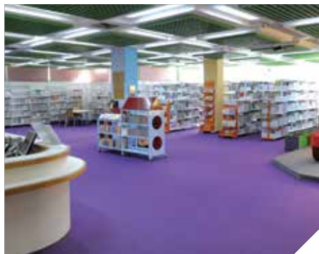
קסם של ספריה

מדי שנה פוקדים את ספריות העיון למבוגרים למעלה מ- 22,000 סטודנטים ותלמידים < מס' השאלות ל-2016, 310,000. < מס' משתמשים במדור האינטרנט כ-4,600 < מנויים חדשים 1380.