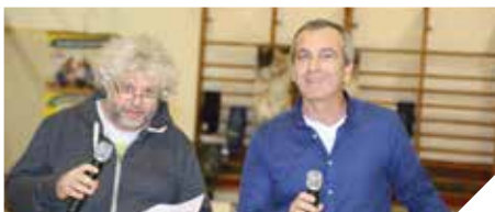
מכבדים את העולים