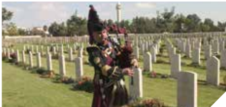
זוכרים את הנופלים במלחמות העולם הראשונה והשניה