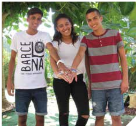
מועצת נוער איכותית

בני הנוער ברמלה שותפים לתהליך חינוכי ערכי, שמאופיין בהתנדבות למען הקהילה. ההתנדבות כוללת עבודה עם קשישים, אוכלוסיית צרכים מיוחדים, מד"א, כיבוי אש, ילדים בסיכון.