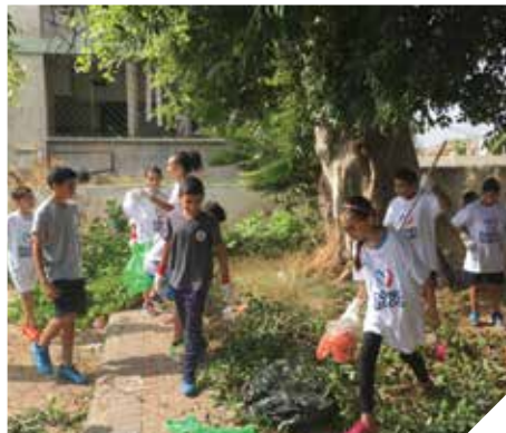
מקדמים סביבה נאה

במסגרת תכנית קידום בריאות וחיבור לסביבה, בסיוע ג'וינט-אשלים וקק"ל הוקמו 5 גינות קהילתיות בשיתוף הציבור ו-18 גינות מאכל לעידוד אכילת ירקות בגני ילדים ומעונות. הגינות הוקמו ע"י ילדים, בני נוער ומבוגרים, שעובדים בהן, לומדים, חוקרים ומטפחים אותן.