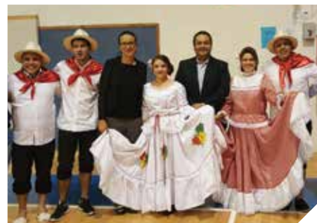
קונסול פרו וקולומביה ברמלה

השנה ציינה העירייה בטכס מיוחד 35 שנה לעלייה מאתיופיה. מאות תלמידים נטלו חלק באירוע בסנין "גבורה ומנהיגות".