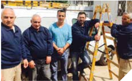
הזרוע הביצועית שמאחורי הקלעים

המחלקה אחראית על מתן שירותי המחשוב לכל מחלקות העירייה, לרבות מוסדות החינוך הרשמיים והלא רשמיים בעיר, בתי הספר וגנ"י המשרתים את אוכלוסיית העיר. שירותי המחשוב ניתנים החל משלב ניתוח צורכי המחשוב ומתן פתרונות אינטגרטיביים כוללים, הן מבחינת חומרה/תוכנה/תקשורת אינטגרציה, הפעלה והטמעה של ממשקי המערכת ועוד.