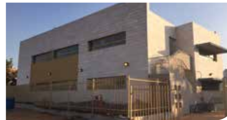
אגף חדש בית הספר "דרור"