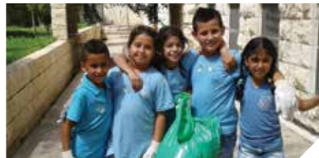
מחנכים לניקיון ואיכות חיים

העירייה ממשיכה לפתח ולשדרג שטחים פתוחים וגנים לטובת תושבי העיר. ברחבי העיר נשתלו בשנה שחלפה אלפי פרחי עונה, דשא סינטטי ונשתלו עצים חדשים גנים ציבוריים רבים עברו מתחת פנים. בכל הגנים הציבוריים בעיר הוצבו מתקנים לאיסוף צואת כלבים, אשפתונים וספסלים. פרויקט מעבר לחיפוי יבש באדניות הושלם בנווה דוד, בנווה מאיר וברחוב מרים הנביאה.