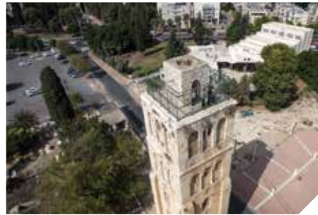
המגדל הלבן. מבט אווירי