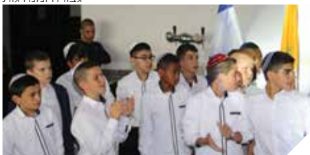
חוגגים בר מצוה לילדי העולים

העיר באמצעות ירידים, חוברות, פליירים, מצגות, שיחות טלפון ומיילים.