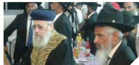
מקדמים את שירותי הדת

המועצה הדתית רמלה הטמיע את תוכנת שירת הים בנישואין, ובחודשים הקרובים תטמיע את