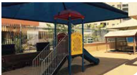
גני ילדים חדשים