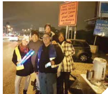
מעודדים נהיגה בטוחה ללא אלכוהול

פרוייקט "נשק וסע" שהורחב לבתי ספר נוספים בעיר בהם: "אורתודוקסי", "שרת", "אחוה", "אופק", "קשת", "האומנים" ו"רעות". בחודש דצמבר התקיימה פעילות לבתי הספר התיכוניים בעיר ובמרכז הפיס בבן צבי. בפעילות הועלתה בפני התלמידים, הצגה ייחודית בעלת מסרים לזהירות בדרכים. בהצגה מתוארת קבוצת "הסל-גל" הייחודית, ספורטאים חסונים מליגות-העל של כדורסל-על-כסאות-הגלגלים, עושה עבודת קודש, עוברת מאולם ספורט אחד למשנהו ונפגשת במשך השנה עם עשרות אלפי תלמידים וחילים. בחורים מופלאים אלה, פצועים בדרגות שונות, יוצאי יחידות עלית בצה"ל ונפגעי תאונות, נרתמו להפצת מסרים.