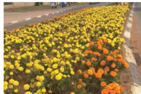
גינן וטיפוח הסביבה