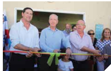
חינוך, חברה ופנאי