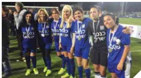
בנחרת בנות הכנסת במשחק גמר הגולסטאריות