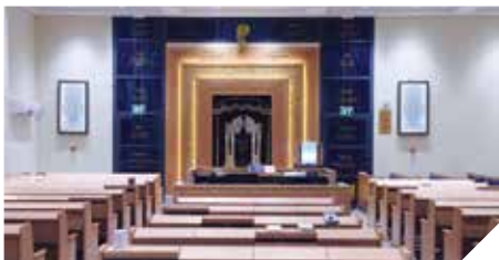
בית כנסת חדש