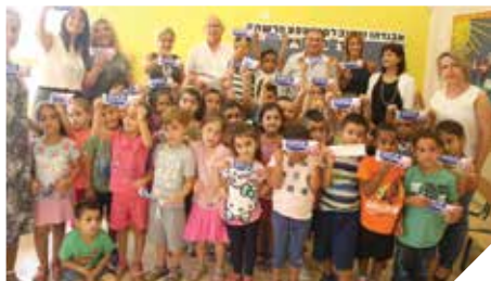
158 גני ילדים

לצד פרויקט ההזנה עיריית רמלה מסבסדת באופן דיפרנציאלי בשיתוף עמותת "לקט ישראל" כריכים לתלמידים בעלי יסודי. תלמידים אלו זוכים לקבל מידי בוקר כריכים עם ממרחים שונים, וכך "על בטן מלאה" יכולים להתרכז בלימודים.