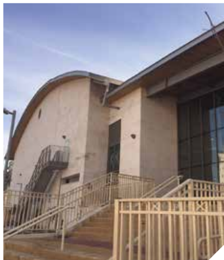
היכל הספורט קרית אומנים

שימש את תלמידי ותושבי העיר בענפי ספורט שונים בהם, כדורסל, כדוריד וכי באולם ייבנו חדרי ספח הכוללים חדר כושר, סטודיו להתעמלות, סטודיו למחול, סטודיו לאומניות לחימה, לובי, מזנון, חדרי הלבשה, חדר שופטים ועוד.