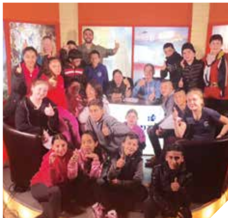
צלם, עושים כאן חיים

מרכז התקשורת העירוני מפעיל בבתי הספר תוכנית ללימודי תקשורת. השנה למדו התלמידים במרכז את רזי עולם הטלוויזיה והרדיו. בנוסף מקיים המרכז קורסים להכשרה לבני נוער ומבוגרים ללימוד טלוויזיה ורדיו. מרכז התקשורת מאפשר לתושבי רמלה להטביע חותם ולקחת חלק פעיל בסדר היום בקהילה.