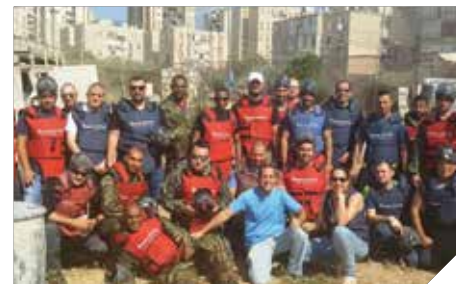
מוקיעים את האלימות

< בקהילה – במהלך השנה התקיימו שורה של פעילויות בקהילה להגברת המודעות למניעת אלימות. בין היתר התקיים יום להגברת המודעות נגד אלימות כלפי נשים, יום עיון בנושא לאנשי מקצוע בשיתוף מחלקת הרווחה והשירותים החברתיים,