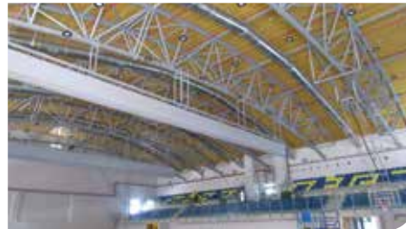
מרכז ספורט מודרני