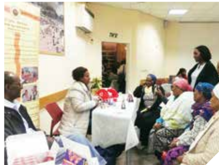
לומדים על בריאות השן

השירות הווטרינרי העירוני ברמלה נקט במגוון פעולות לצמצום ולמניעת מטרדים ומחלות הנגרמים על ידי בעלי חיים וכן פעל לרווחתם: טופלו כ- 1423 תלונות על מטרדי בעלי חיים * נלכדו 439 כלבים וחתולים משוטטים /1 או פצועים * * בוצעו 1504 חיסונים לכלבים והוצאו עבורם רישיונות החזקה כדון * נערך פיקוח שוטף על הכלבים המוגדרים כמסוכנים * טופלו 24 אירועי נשיכת אנשים * מעל 400 חתולים עוקרו/סורסו בצורה יזומה חשבון העירייה * הוחרמו כ-60 כלבים עקב עבירות צער בעלי חיים* .