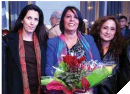
דאגים לזכויות התושב

הלשכה המשפטית העירונית מטפלת בהיבטים המשפטיים של עבודת העירייה, ומספקת שירותי ייעוץ וטיפול משפטי לאגפי העירייה השונים בכל תחומי פעילותם. הטיפול המשפטי וייצוג העירייה מהווה חלק בלתי נפרד מהשירותים לתושב, המופנים לרווחת התושבים.