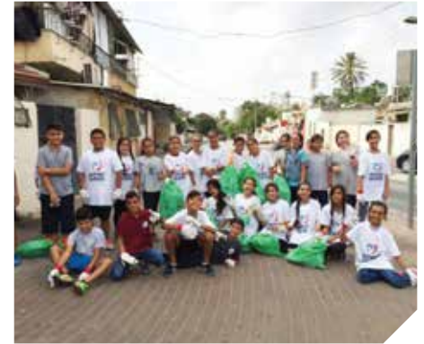
שותפים להגנה על הסביבה

במשך שנים העירייה מפנה גזם בכל רחוב שלוש פעמים בשבוע. את הגזם יש להוציא עד השעה 10:00 בבוקר ביום הפינוי. גזם דשא יש להכניס לתוך שקית. בכדי לשפר את חזות העיר הוחלט לעבור לפינוי גזם פעם בשבוע. בשכונת קריית מנחם בגין, רמת דן, גני דן, יפה נוף, קריית האומנים המהלך כלל הצבת עמדות מבטון לגזם, פרסום ואכיפה. במהלך עמדות מבטון 2017 יצורפו שכונות נוספות. שיתוף הפעולה של התושבים יבטיח ריכוז הגזם בצורה מסודרת ושמירה על חזות פני העיר.