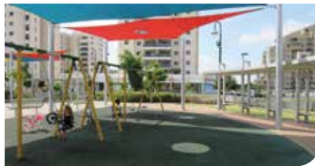
פארקים ומתקני משחקים