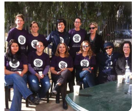
מתנדבים בביטוח הלאומי

וקבוצתית, הפניות למכוני ייעוץ. מסגרות יום ארוך לילדים הזכאים לכך באשכול גנים לימן ובבית ספר יובלים. מרכזי תעסוקה, מרכז סיעודי ומועדון חברתי. אק"י"ם, טל. 08-9771631