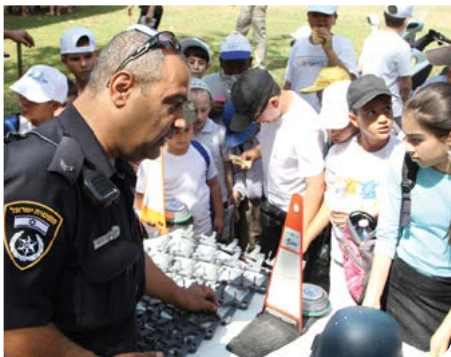
יום משטרה קהילה

העירייה, בשיתוף המשרד לביטחון פנים ומשטרת ישראל, הקימה יחידת שיטור עירוני המורכבת מ-30 שוטרים ופקחים. היחידה עוסקת בכל העבירות הקשורות לאיכות חיי התושבים, לרבות אכיפת רעש, ונדליזם, מצבי חירום והגברת הפיקוח בשוק העירוני ובשכונות העיר. הפעלת היחידה החדשה הביאה לשיפור משמעותי ברמת השירות לתושב, איכות חייו ותחושת הביטחון האישי.