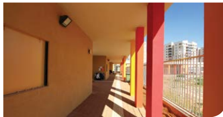
סביבה חינוכית לילדים