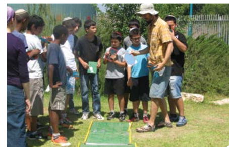
מנהיגות לאהבת הטבע

כחלק מתוכנית שיפור חזות העיר נצבעו כ-100 ארונות סעף עם ציורי נוף וסביבה מרהיבים.