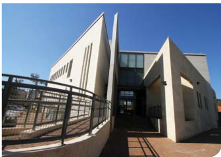
מרכז קהילתי רוחני