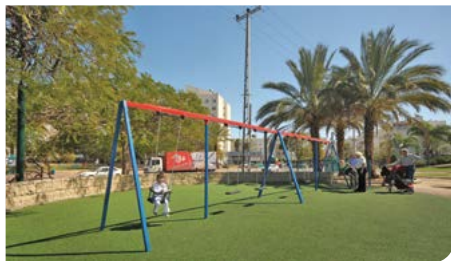
גנים ופארקים חדשים

בשיתוף מפעל הפיס והעירייה הוקם מרכז רוחני רחב ידיים לאוכלוסייה הדתית ברחוב בר אילן. מרכז מודרני בן שתי קומות הנפרס על שטח של כ-800 מ"ר. במרכז הושקעו למעלה מ-7 מיליון שקלים והוא כולל חדרי לימוד, חדר מחשבים ואולם כנסים המעניקים מגוון שרותי תרבות, חוגים ולימודי תורה.