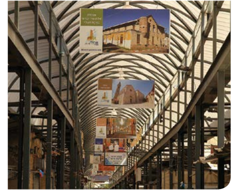
חוויות קנייה בשוק רמלה

נמכר לבודדים או לקבוצות דרך האינטרנט או במוזיאון רמלה. www.shukramla.co.il טלפון מוזיאון: 08-9292650