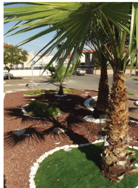
גינות וטיפוח הסביבה