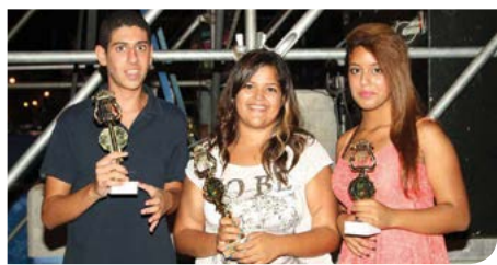
יותר לבני הנוער

מועצת הנוער העירונית ברמלה כוללת נציגים מבתי הספר, תנועות הנוער וגופי נוער אחרים. נציגי המועצה השתתפו השנה בוועדות חינוך עירוניות ובמליאות נוער מחוזיות. חברי המועצה נפגשים לישיבה שבועית שוטפת, דנים בצרכי בני הנוער בעיר ומתרגמים אותם ליוזמות ולפעילויות מעשיות בשטח, ביניהן "תנו לי צ'אנס", ערב כישרונות צעירים, ריכוז פרויקט "לתת" בעיר, שידור תוכניות ברדיו רמלה, השתתפות בעיר הנוער בקיץ, הפקת כתבות טלוויזיה למגזין "מבט לקהילה", יוצרים עם קשת ועוד.