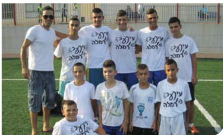
מקדמים את הספורט, עיר הנוער

כנס רמלה הכנס "בין ישראל לעמים" התקיים באשכול פיס באסרו חג של פסח בהשתתפות שרים, חברי כנסת, רבנים ואישי ציבור. פרוייקט זוזו בשנת 2013 החל לפעול בעיר פרוייקט זוזו ב-13 בתי ספר. התוכנית מעודדת חינוך גופני ועיסוק בספורט בענפים שונים בהם: אתלטיקה, כדורסל, התעמלות, טניס ועוד.