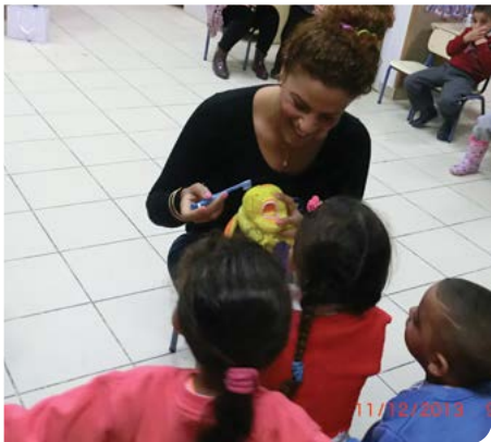
מחנכים לבריאות השן

צוות מרפאת השיניים העירונית ממשיך בפעילות הקלינית והחינוכית לשיפור מצב שיניהם של תלמידי ותושבי העיר. בנוסף, מתבצעות בדיקות שיניים במסודות החינוך ושינויות מעבירות הדרכות לתלמידים.