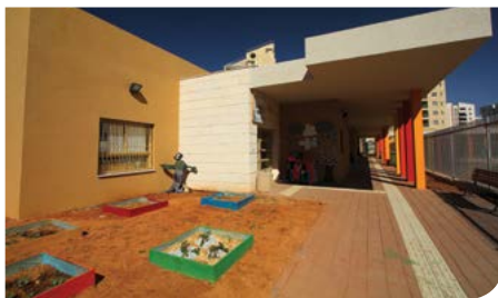
גני ילדים חדשים