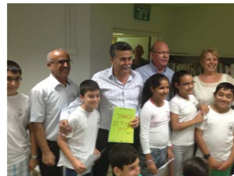
מקדמים את איכות הסביבה

רמלה קיבלה ב-2013 את אות המחזורית המצטיינת "מאדם טבע ודין ותאגיד אל"ה, באיסוף בקבוקים משפחתיים של 1.5 ליטר. תאגיד אל"ה קיים הפנינג גדול במהלך חופשת הקיץ וברחבי העיר חולקו גלידות וארטיקים לילדים שהביאו בקבוקים למחזור.