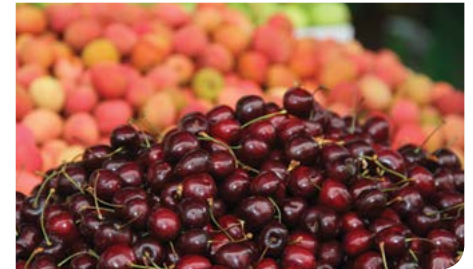
מגוון מוצרים איכותי וזול

במתחם בריכת הקשתות העתיק הותקנו אמצעי בטיחות חדשים ושודרגו מערכות החשמל, התאורה והניקוז.