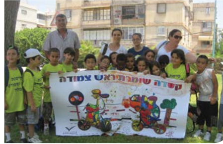
קסדה בראש טוב

תוך שכרות ובהשפעת סמים בזמן נהיגה. בבתי הספר עמל טכנולוגי, יובלים, שחקים, נווה יונתן ועיזנים הועלתה ההצגה "הנסיעה האחרונה", על נהג שכתוצאה מרשלנותו פגע בנער בעת שחצה את הכביש. בהצגה ניתן דגש על הצד הפוגע.