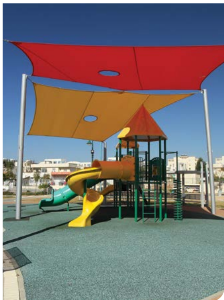
הצללות ומתקני משחק