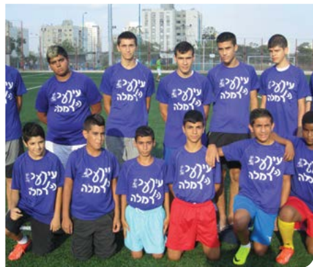
מעודדים אורח חיים ספורטיבי

9 חוכמים יחד מועדון אופניים הוקם בשכונת ג'אריש. רשומים בו 30 חניכים, 15 מהם תלמידי בית ספר ג'אריש ו-15 מבית הספר המקיף הערבי. המיזם פעל בניהול מחלקת הספורט והאירועים בשיתוף חברת דרך ארץ, משטרת רמלה, תוכנית עיר ללא אלימות ובתי הספר.