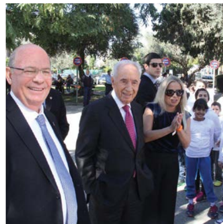
ביקור הנשיא - שמעון פרס

במערכת החינוך העירונית לומדים כ-17,202 תלמידים ★ בעיר 23 בתי ספר יסודיים ★ 5 חטיבות ביניים ★ 12 מוסדות חינוך תיכוניים ★ 3 בתי ספר לחינוך מיוחד ★ 123 גני ילדים