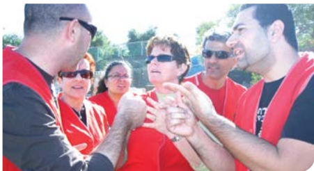
סירת הורים בפעולה

מתוך רצון לשפר השירות נבנתה כתובת מיוחדת לפונים חדשים למחלקת הרווחה לאבחון צרכים, הכוונה, הדרכה והפנייה. על פי האבחון יינתן המענה או יועבר לטיפול לגורם המתאים בתוך או מחוץ למחלקה.