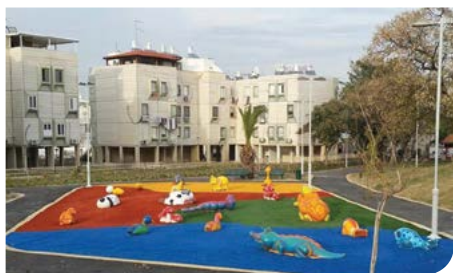
משחקי גן לרווחת הילדים