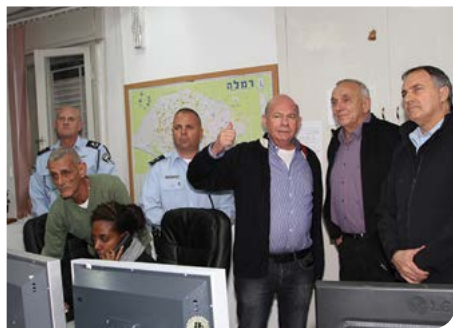
יתר מצלמות וביטחון אישי

עיריית רמלה, בשיתוף פיקוד העורף, המשרד להגנת העורף וגורמי החירום ביצעה במהלך 2013 שורה של תרגילי חירום, בהם רעידת אדמה, מלחמה, משבר מים, תרגול מערך הדוברות ועוד.