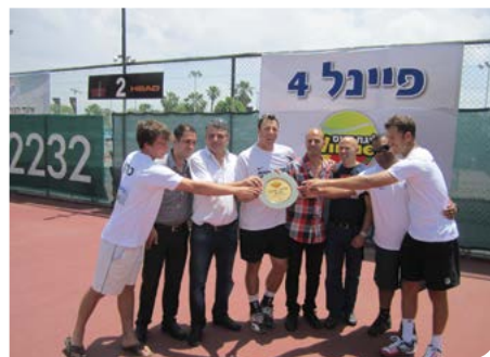
אליפות מס' 16

בנוסף לפסטיבל המחולות הבינלאומי שמתקיים מדי שנה בעיר, הפיקה מחלקת הספורט והאירועים בחודש אוגוסט את 'פסטיבל שירת הרחובות' שהתקיים בשכונת קריית האומנים ואת 'פסטיבל העדה היהודית' שהתקיים בסוכות בפארק עופר.