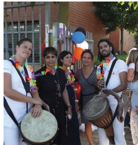
פותחים שנה בתופים ומחולות

כיום נהנים 3,586 תלמידים הלומדים יום לימודים ארוך בבתי הספר. המזון נבדק על ידי המחלקה לבריאות הציבור. ההשתתפות בפרויקט כרוכה בתשלום הורים סמלי של 6.3 שקלים בלבד למנה. הורים שאינם יכולים לעמוד בתשלום זכאים לפנות לוועדת ההנחות בבית הספר. ההנחות, המגיעות למאות אלפי שקלים בשנה, מסובסדות על ידי העירייה.