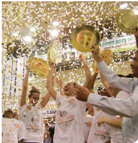
אלופות והן שלנו

אלופת הוורוקאפ אליצור רמלה המשיכה גם השנה בהישגיה המרשימים כשזכתה ב-2013 באלופות המדינה בפעם התשיעית, וזכתה בגביע המדינה לשנת 2013-2014. כבוד!