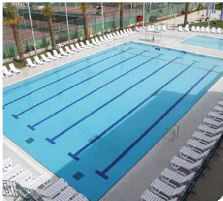
מתקן שחייה מקורה ומודרני

נותנת מענה לכלל תושבי רמלה במגוון חוגים, לימוד שחייה חדר כושר ועוד. בימים אלה מסתיימת עבודת קירוי הבריכה, כשגג חשמלי מותקן לרווחת התושבים. בבריכה יפעלו מגוון חוגי שחייה לרווחת התושבים.