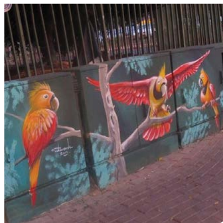
משפרים את חזות העיר

השקו את הגינות בשעות הערב רחצו את הרכב עם דלי וסמרטוט במקום בצינור התקינו חסכמים מנעו הצטברות של מקווי מים עקב דליפת דודים או הצפת מקלטים המהווים מקור לדגירת יתושים. אנא, היו עירניים בנושא.