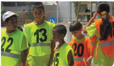
מרכז הדרכה פעיל

נערכה פעילות חווייתית בנושא נהיגה תחת סמים ואלכוהול מתוך לחץ חברתי וחשיבות חגורת הבטיחות. בית הספר זכה בפרס המחוזי בנושא הזהירות בדרכים.