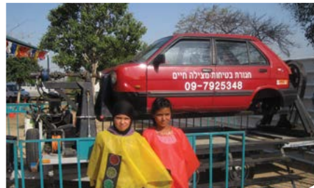
יותר זהירות בדרכים

במסגרת פרויקט מחויבות אישית, קיבלו התלמידים הדרכה אישית לקראת ביצוע משימתם: הדרכת תלמידי כיתות א'-ב' לחצייה נכונה ובטוחה ברחבי העיר.