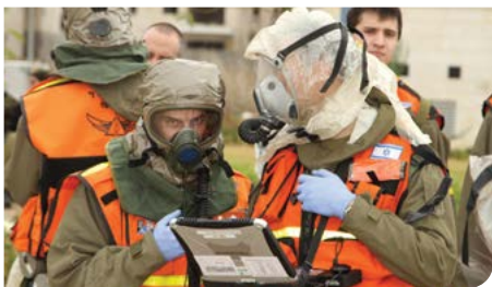
מתרגלים את העורף