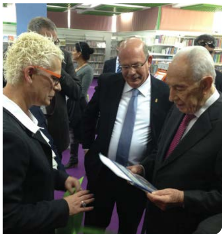
ביקור נשיאותי בספרייה