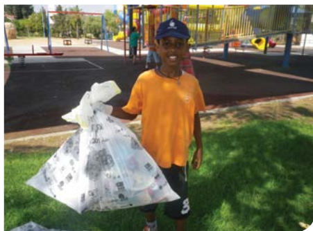
מנקים את הסביבה

גני ילדים שכבר הוסמכו בעבר. סניף בני עקיבא קיבל תו ירוק על פעילות סביבתית.