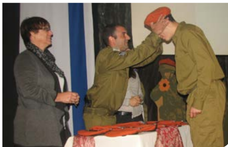
יותר למען המיוחדים

7 למען שיקום המתמכרים המרכז לטיפול בהתמכרויות ושיקום האסיר. טל. 08-9771610