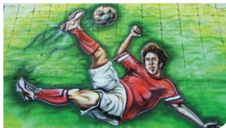
ציורי קיר מרהיבים